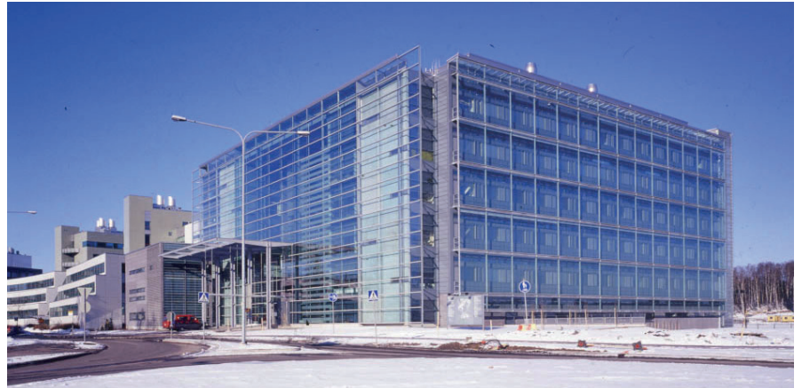
Helsingin yliopiston Biokeskus 3:n ikkunakalvoksi valittiin nano-teknologiaa hyödyntävä 3M Prestige -auringsuojakalvo, joka ei muuta rakennuksen ilmettä, mutta alentaa merkittävästi lämpökuormaa.

* Edellyttää, että 3M-ikkunakalvojen kiinnityksen suorittaa valtuutettu asennusliike, jolloin 3M-takuu on voimassa.