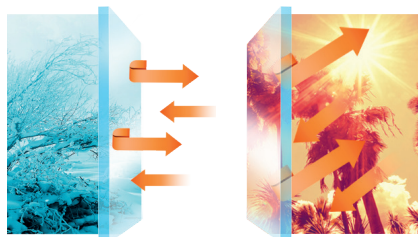
Energiakalvo pitää talvella lämmön sisällä ja kesällä sisätilat viileämpinä.

3M-turvakalvot ovat erikoissuojaavia kalvoja lasille räjähdysten tai henkilön tuottamaa iskuja vastaan. Vahinko voidaan rajoittaa vain rikkoutuneen lasin vaihtoon. 3M-turvakalvoja on mahdollista saada kirkaana tai harmaan sävyisenä kalvona. Sävytetty 3M-turvakalvo toimii samalla auringonsuojakalvona.